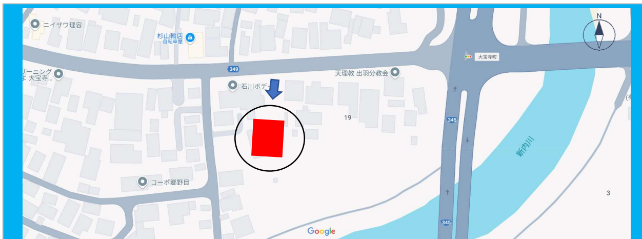
この図面は物件情報の一部を抜粋して掲載しております。(現況優先)